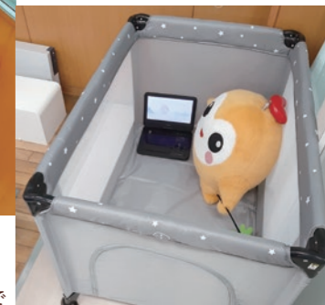
ベビーサークル3才(15kg)まで