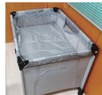
バシネット(簡易ベッド)8kgまで

「歯科治療を受けたいけれど、子守をしてくれる人が近くにいない。毎回親に頼るのも気が引ける。」とお考えの方はいませんか?当院では診察台の足元にベビーカーを置くことができます。また3才まで対応のベビーサークルもご用意しておりますので、診察台の近くに設置して治療中も様子を見ることができます。ポータブルDVDプレーヤーの貸し出しもごございますので、ベビーサークル内か待合室でご覧いただけます。ぜひご利用ください。*予約制となりますので事前にご連絡ください。